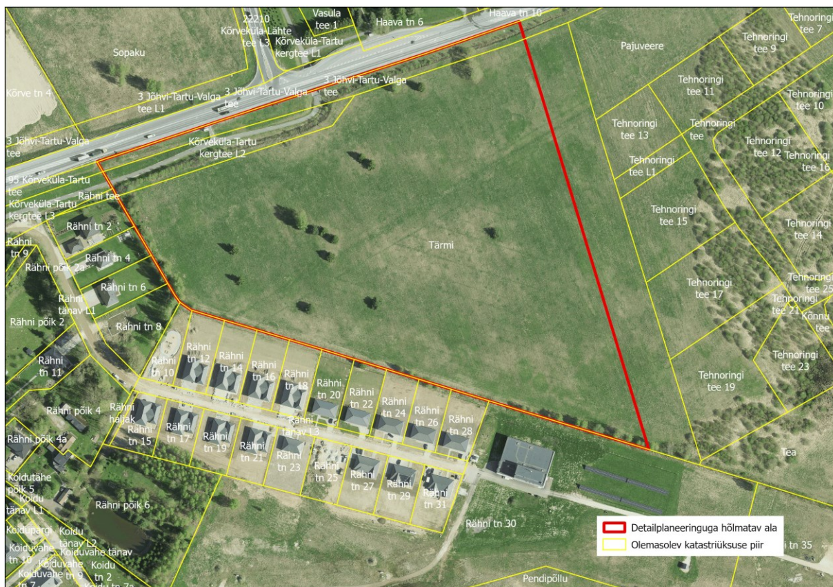
Joonis 1. Planeeritava ala skeem (alusjoonis: Maa-ameti geoportaal)

Planeeringu eesmärgiks on Tila külas asuv Tärmi maaüksus (katastritunnus: 79403:002:0838) jagada üksikelamu maa ning kaksikelamu maa kruntideks ning määrata ehitusõigus elamute (üksikelamud, kaksikelamud ja abihooned) ehitamiseks. Lisaks antakse lahendus liikluskorraldusele, haljastusele, heakorrale ja tehnovõrkudega varustamisele. Planeeringuala pindala on ca 9 ha (vt. joonis 1).